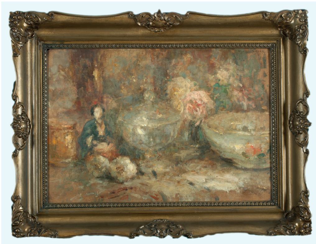
Martwa natura z lalczką Olga BOZNAŃSKA

„[...] obrazy moje wspaniale wyglądają, bo są prawdą, są uczciwe, pańskie, nie ma w nich małostkowości, nie ma maniery, nie ma blagi. Są ciche i żywe i jak gdyby je lekka zasłona od patrzących dzieliła. Są w swojej własnej atmosferze”.