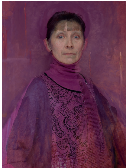
Olga Boznańska – Jestem sobą, tobą, nią, 2024 Iwona DEMKO