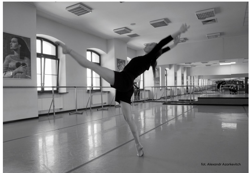
fot. Alexandr Azarkevitch