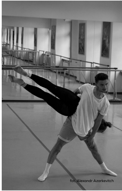
fot. Alexandr Azarkevitch